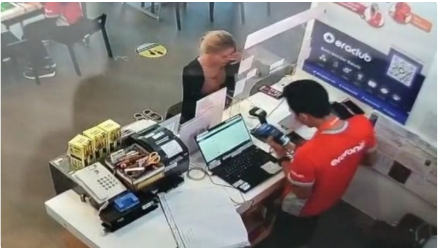
Gambar: Hasil CCTV di Erafone Palangka Raya Jalan Setd Aji, MA saat transaksi menggunakan kartu ATM BNI milik IG

PALANGKA RAYA - Anak angkat mantan oknum Kepala Dinas (Kadis) Kabupaten Pulang Pisau (Pulpis), dilaporkan ke pihak aparat kepolisian Polda Kalteng, Selasa (09/05).